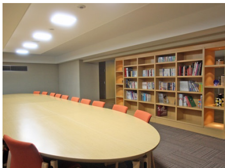
ライブラリー（集会室）