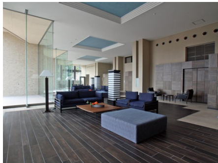
エントランスロビー