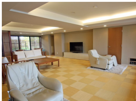
リラクゼーションルーム