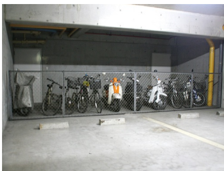
駐車場と自転車置き場