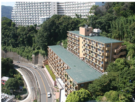
国道135号線に面した外観