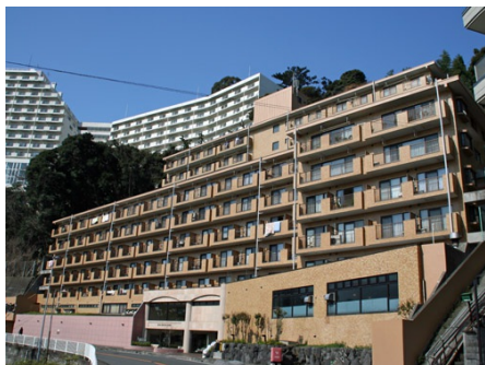
マンション外観 全景