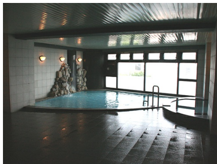
見晴らしの良い温泉大浴場