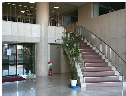
吹き抜けの明るいエントランス