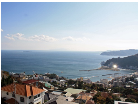
マンションからの眺望