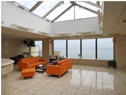
開放的なエントランス