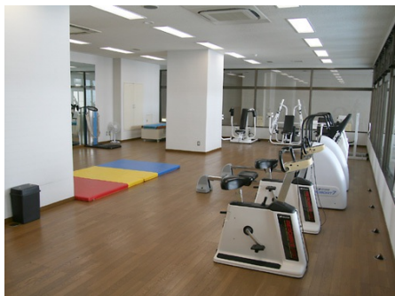
充実したスポーツルーム