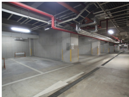
屋内駐車場（高さ制限あり）