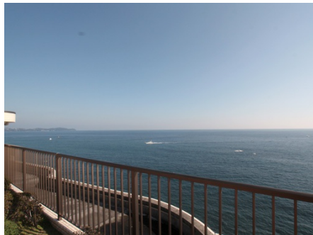
マンション目の前はすぐ海